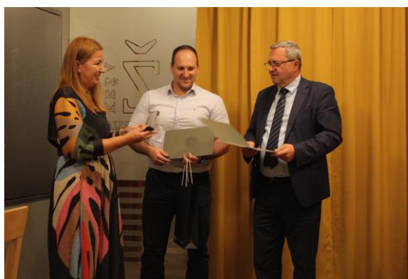
Slika 7. a) Otvorenje i podjela nagrada na Izložbi studentskih radova,