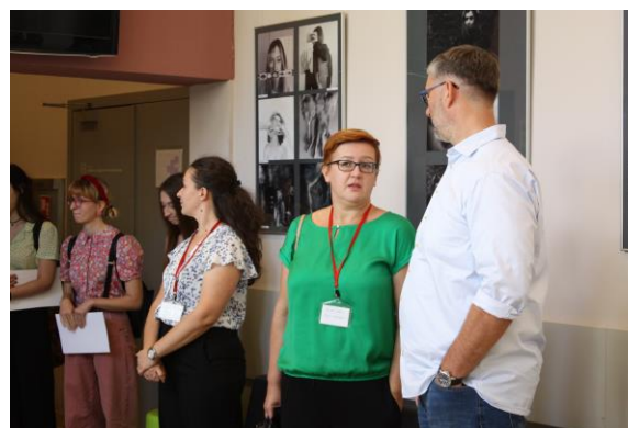
Slika 11. Otvorenje izložbe fotografija