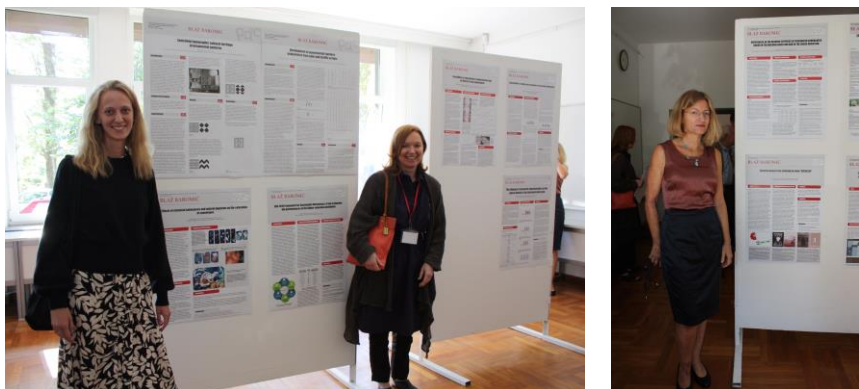
Slika 6. Posterska sekcija Konferencije Blaž Baromić

MEĐUNARODNA KONFERENCIJA TISKARSTVA, DIZAJNA I GRAFIČKIH KOMUNIKACIJA