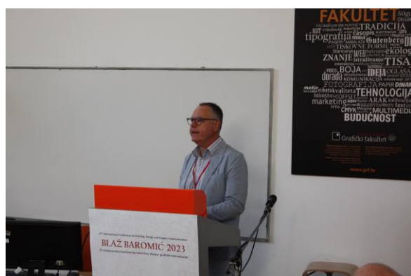
b) Podjela nagrada za Natječaj za grafički proizvod