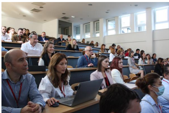
Slika 3. Radni dio znanstvene konferencije

MEĐUNARODNA KONFERENCIJA TISKARSTVA, DIZAJNA I GRAFIČKIH KOMUNIKACIJA