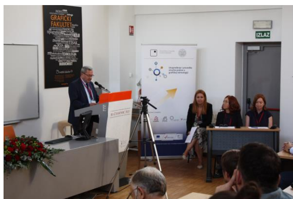
Slika 2. Uvodna riječ prof. dr. sc. Klaudia Papa, dekana Grafičkog fakulteta Sveučilišta u Zagrebu