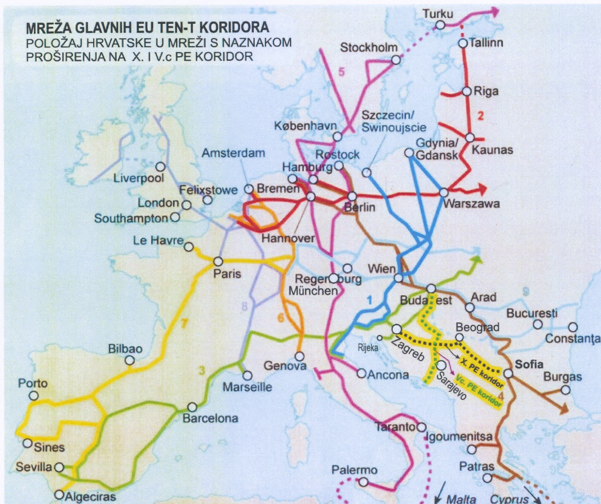
Slika 2. Prikaz devet glavnih EU TEN-T koridora