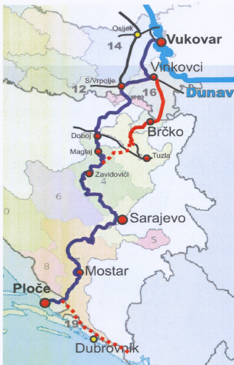
Slika 3. Varijante trase intermodalnoga koridora Ploče-Vukovar (prema prijedlogu Konzorcija Neretva)

Važno je spomenuti da su višegodišnje razdoblje inertnosti u postavljanju nacionalnih stratejskih prioriteta prometnog razvoja, susjedne države iskoristile za afirmaciju konkurentskih pravaca u svojim zemljama, provele intenzivnu modernizaciju postojećih željezničkih pruga i inicirale nove investicije u prometnu infrastrukturu putem zajmova europskih, kineskih, ruskih i arapskih financijskih institucija.