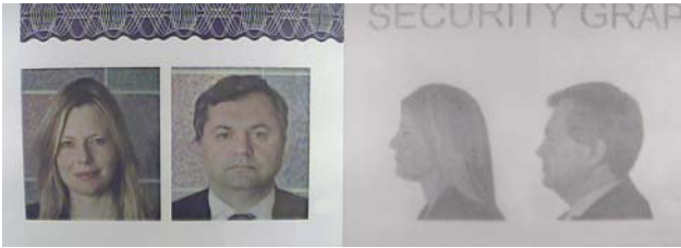
Primjer INFRAREDESIGN slika (RGB i Z)

nm. Dokazano je da ne postoji korelacija između Z, R, G i B veličina. To znači da možemo kreirati beskonačno mnogo RGB boja s jednakim Z kao i jednakih RGB tonova boja za različite Z.